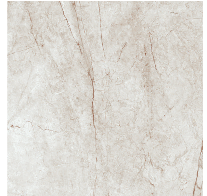
Rain Forest White Pul 100x100 R