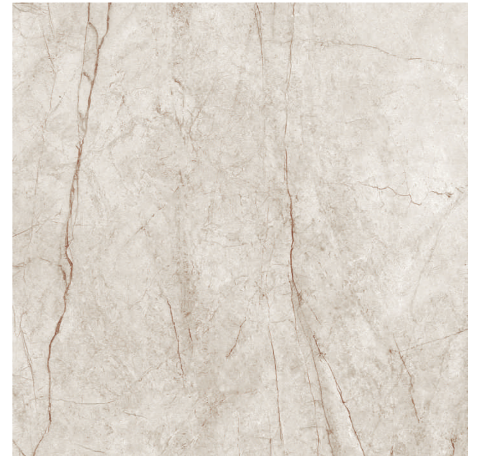
Rain Forest White Pul 120x120 R