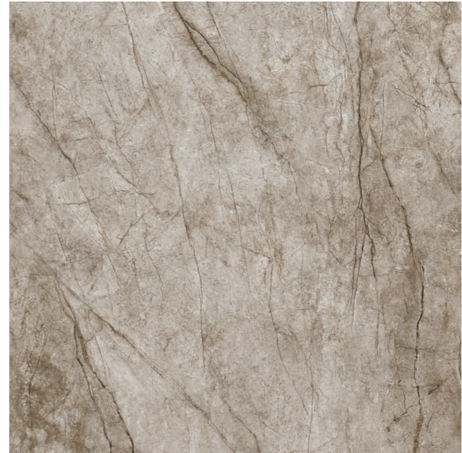
Rain Forest Natural Pul 120x120 R