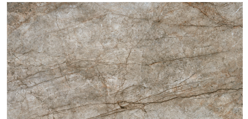
Rain Forest Natural 60x120 R