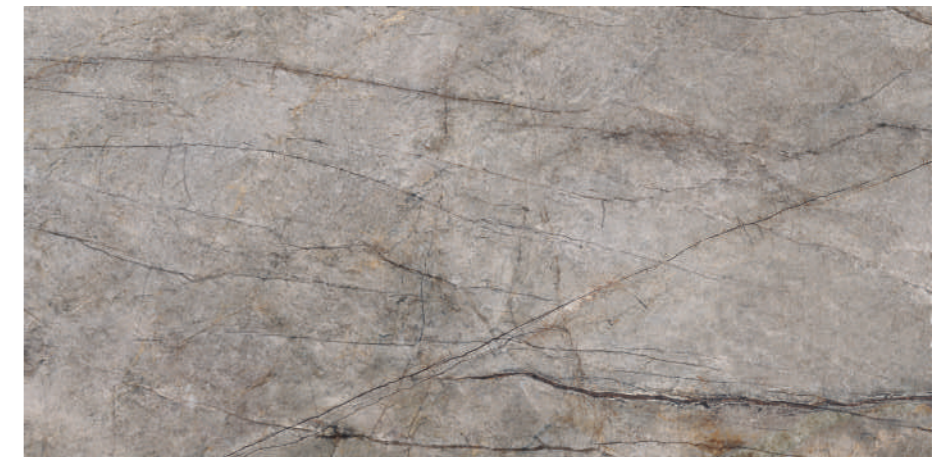
Rain Forest Natural Pul 60x120 R