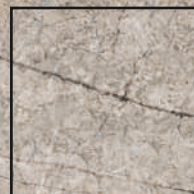
100x100 R 40"x40" R