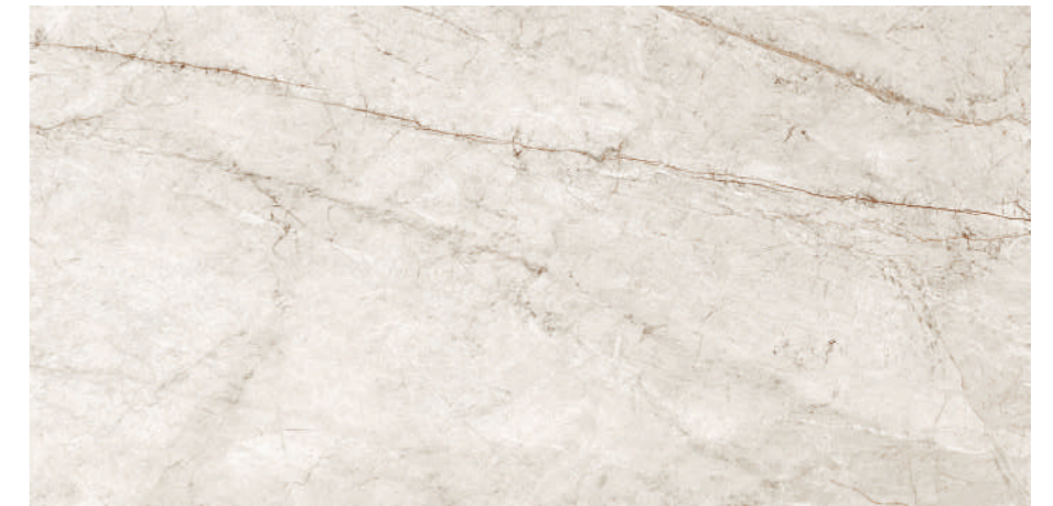
Rain Forest White 60x120 R