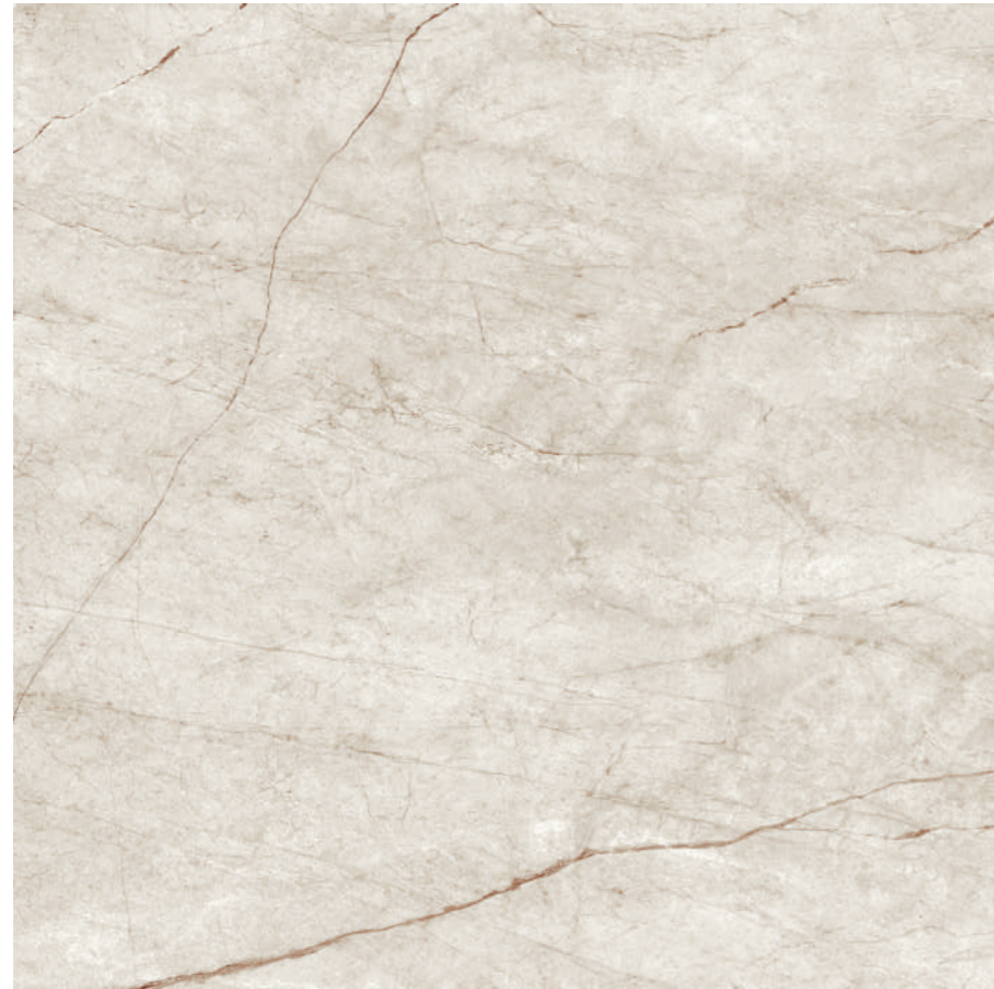
Rain Forest White Pul 120x120 R