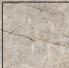
120x120 R 47¼"x47¼" R