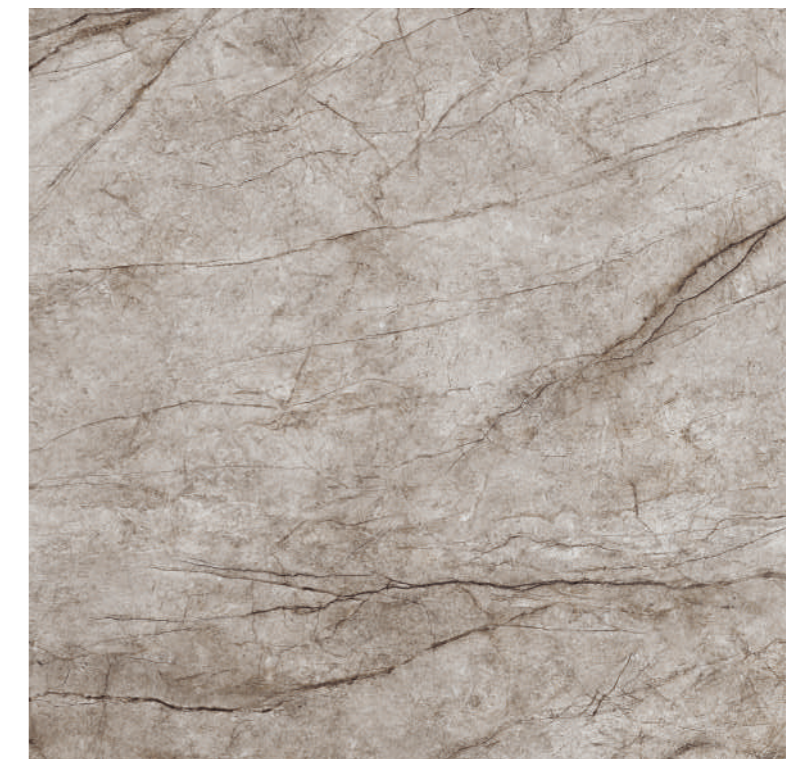
Rain Forest Natural Pul 100x100 R