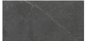
PIETRA ANTICA NERO P6012RE