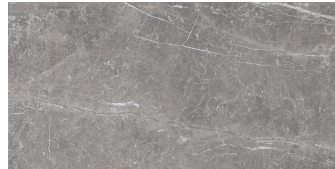
PIETRA ANTICA GRIGIO P6012LB