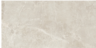
PIETRA ANTICA CREMA P6012LB