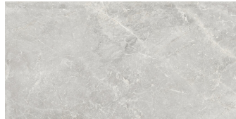
PIETRA ANTICA CENERE RECTIFICADO P6012LB