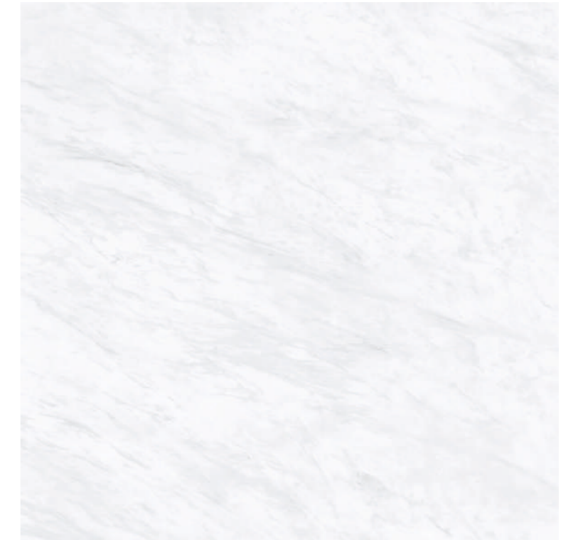
Galdana White Pul 100x100 R