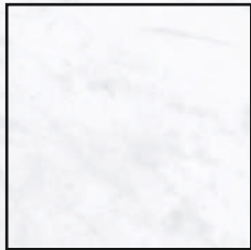
120x120 R 47¼"x47¼" R