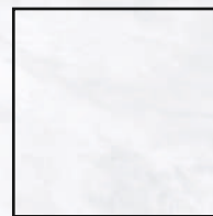
100x100 R 40"x40" R