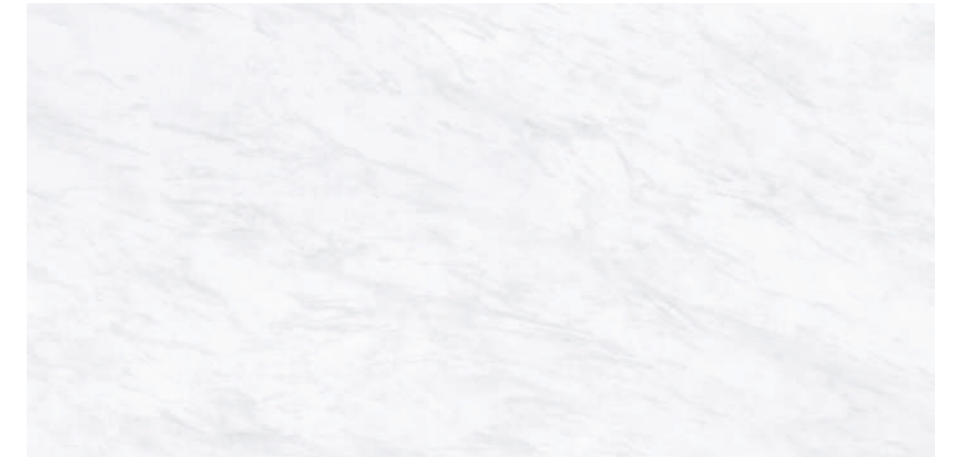
Galdana White Pul 60x120 R