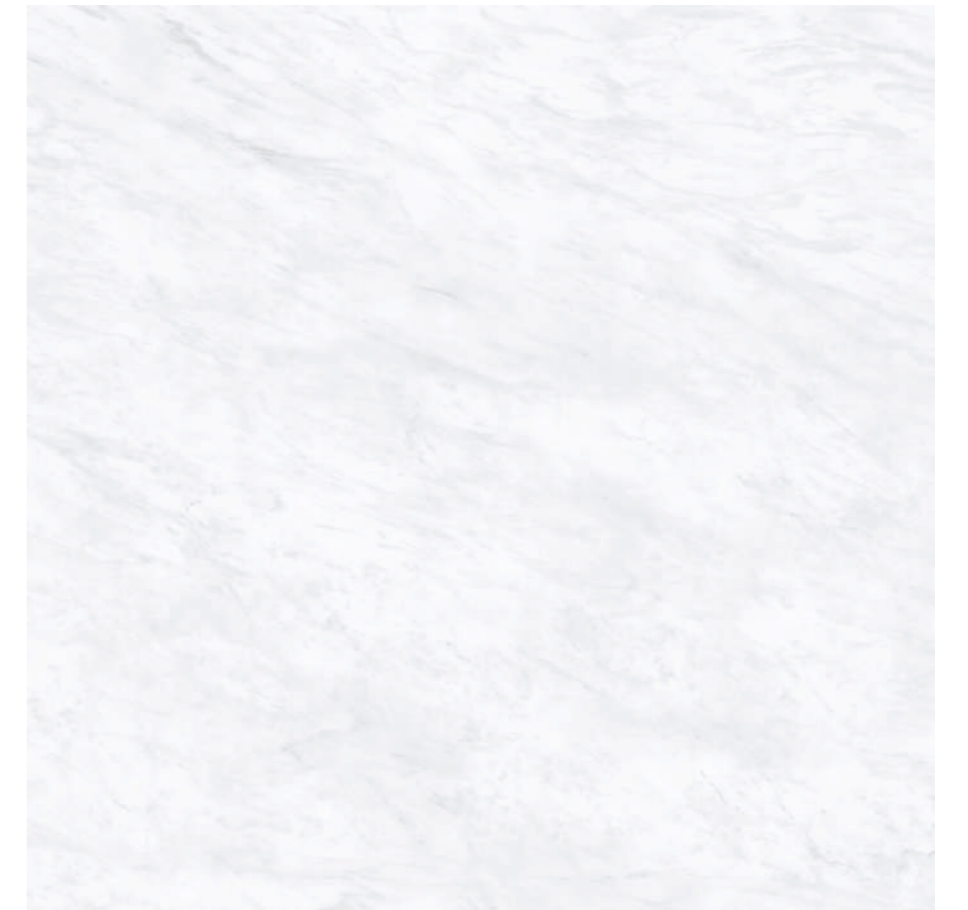
Galdana White Pul 120x120 R