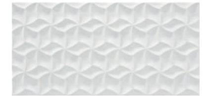
Star Galdana White 25x50 G1226