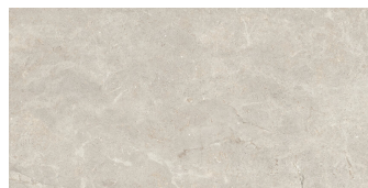
ACADIA IVORY P6012L