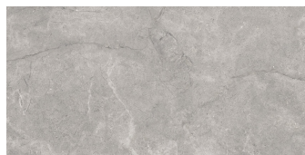
ACADIA GREY P6012L