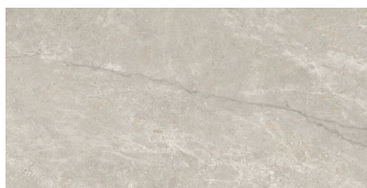
ACADIA CREAM P6012L